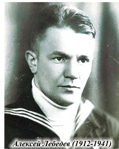
Алексей Лебедев (1912-1941)

Содержание данной газеты не рекомендовано лицам до 12 лет.