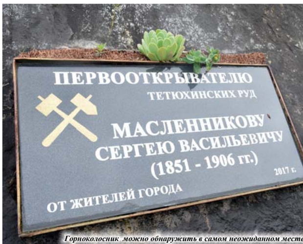
Горноколосник можно обнаружить в самом неожиданном месте

Любопытно, что сохранить чистоту вида горноколосников практически невозможно, так как они легко переопыляются и дают расщепление признаков в потомстве. Может ещё и поэтому изолированная плантация горноколосника на высоком засушливом гребне Партизанского распадка чувствует себя прекрасно, десятилетиями радуя редких посетителей этих заповедных мест.